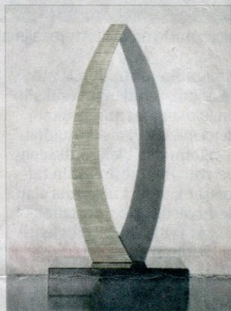
Kohti taivasta, uniikki pronssi-veistos, 2013.

”Tämä on minulle kuin riemuvoitto. Joku unelma on toteutunut.